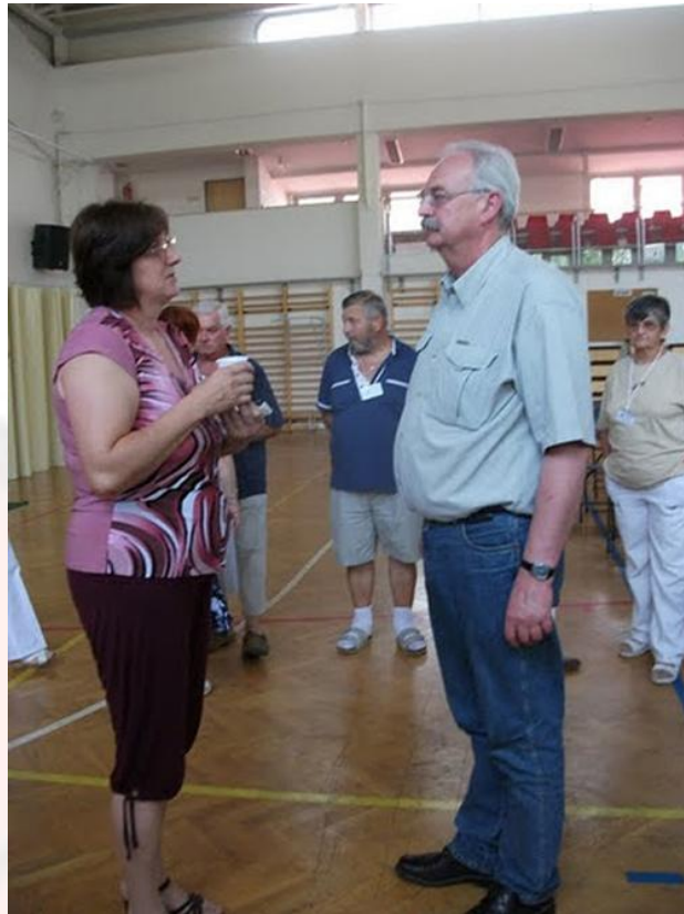
Makón, a Szívtranszplantáltak Találkozásán