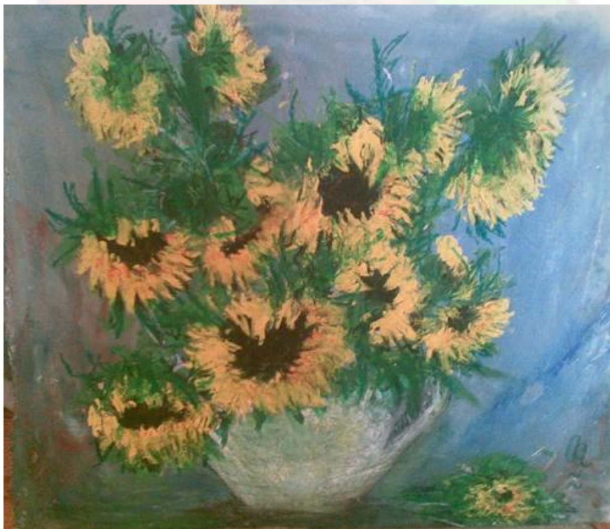
Bokor Zita festménye

Ahogy a székelybácsi mondja: “Élj sokáig és halj meg hamar!”