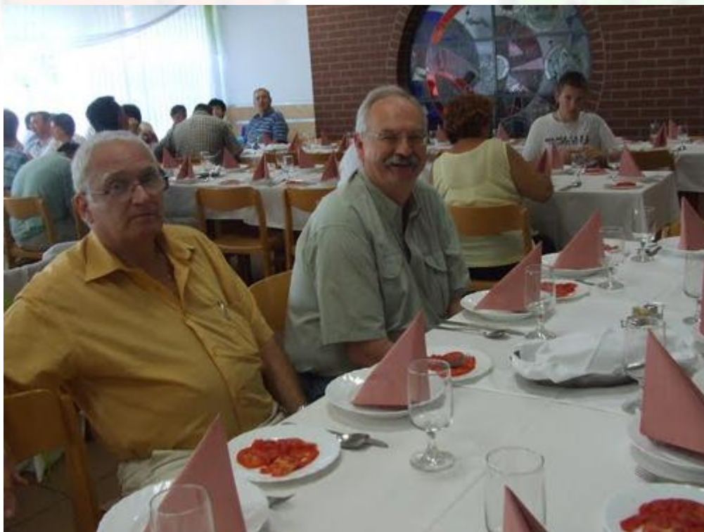
Makón, a Szívtranszplantáltak Találkozásán