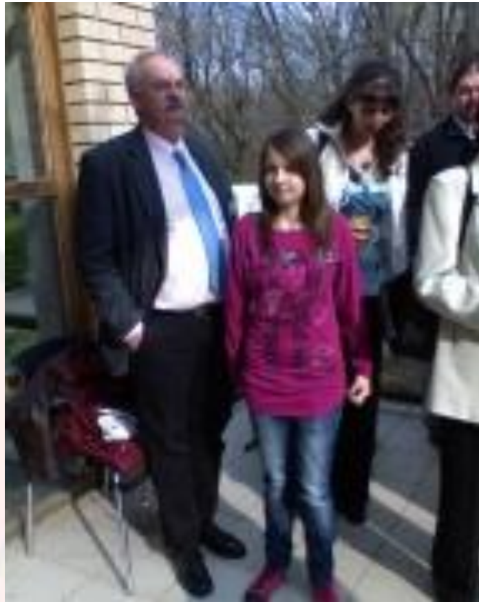
I. Országos Marfan Találkozó (ORMATA)