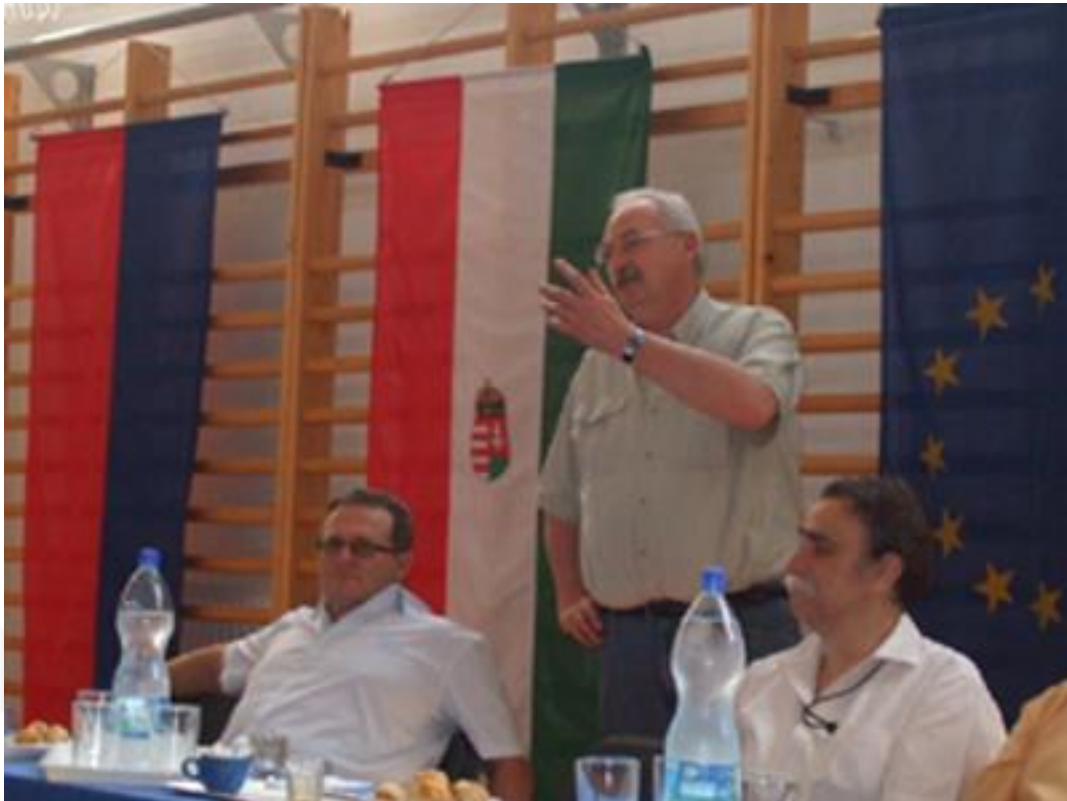
Makón, a Szívtranszplantáltak Találkozóján