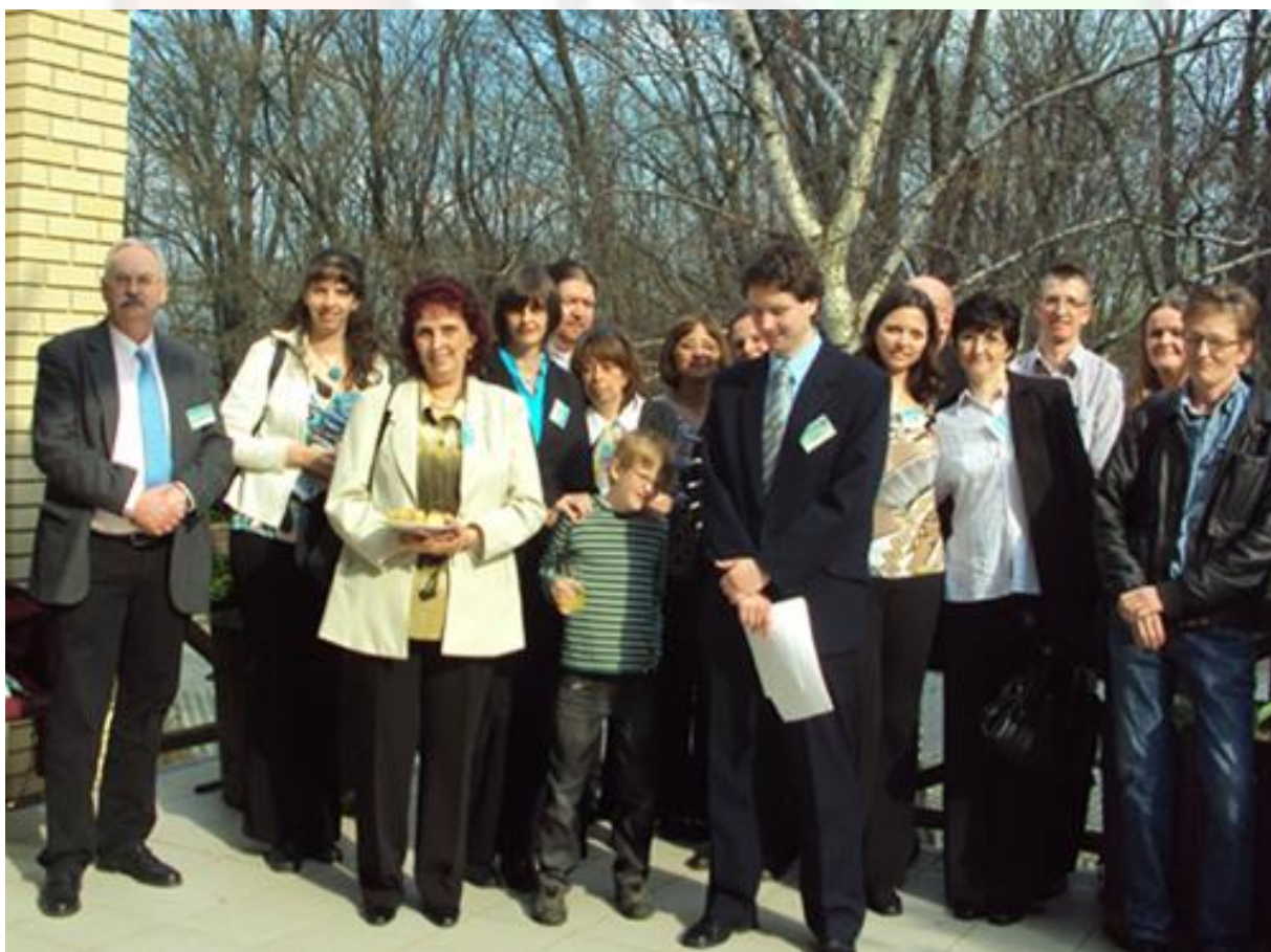
I. Országos Marfan Találkozó (ORMATA)

Attól a pillanattól kezdtem el a tisztelet mellett szeretni is Tanár Urat, mert úgy beszélt velem, ahogyan Édesapám szokott.