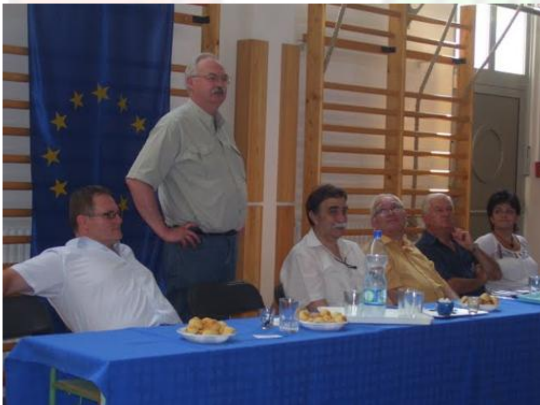
Makón, a Szívtranszplantáltak Találkozóján